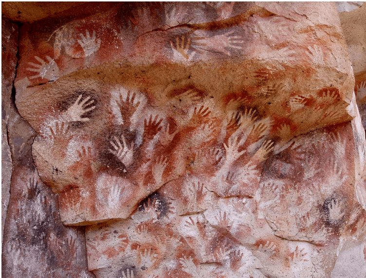
Figura 1: Cova de les mans a la Patagonia, Argentina.

escenes de representacions d'animals i també de figures geomètriques de caràcter simbòlic.