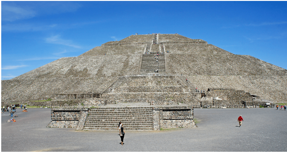
Figura 5: La Piràmide del Sol a Teotihuacan.

Teotihuacán és una de les més grans concentracions urbanes de Mesoamèrica i la seva estructura quadripartida (una avinguda transversal i el Camí dels Morts que es creuen en un centre simbòlic que se situa en una cova, sota la Piràmide del Sol) serà un model que es repetirà al llarg del temps, especialment en la zona central de Mèxic.