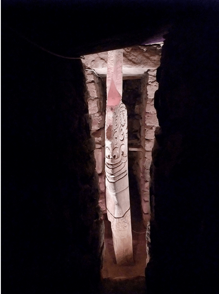
Figura 4: El lanzón monolític. Té la forma d'una gegantina punta de projectil i es troba en un dels corredors del Temple Vell de Chavín. Representa un déu antropomorf amb boca de felí i cabellera de serps.