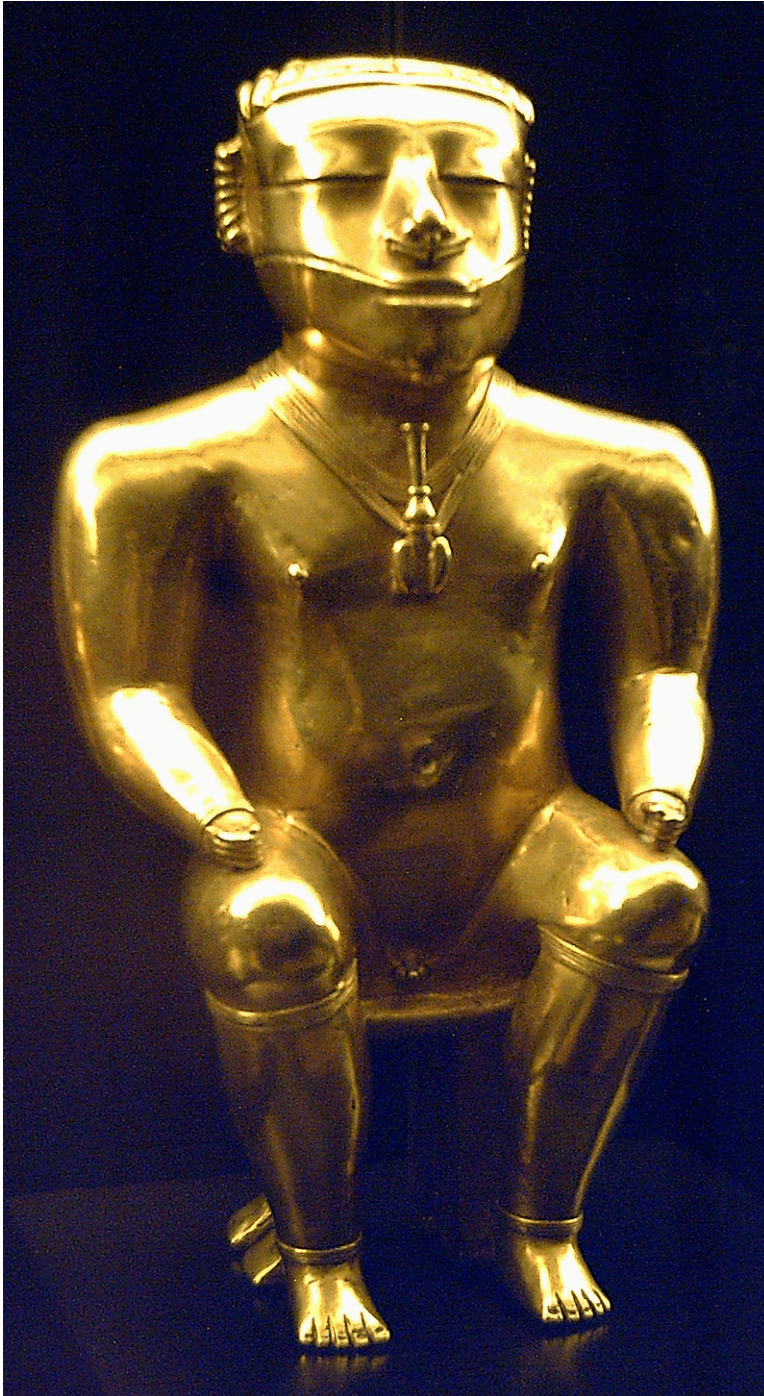
Figura 9: Estatuilla Cacique, dels tresors dels Quimbayas. Or.