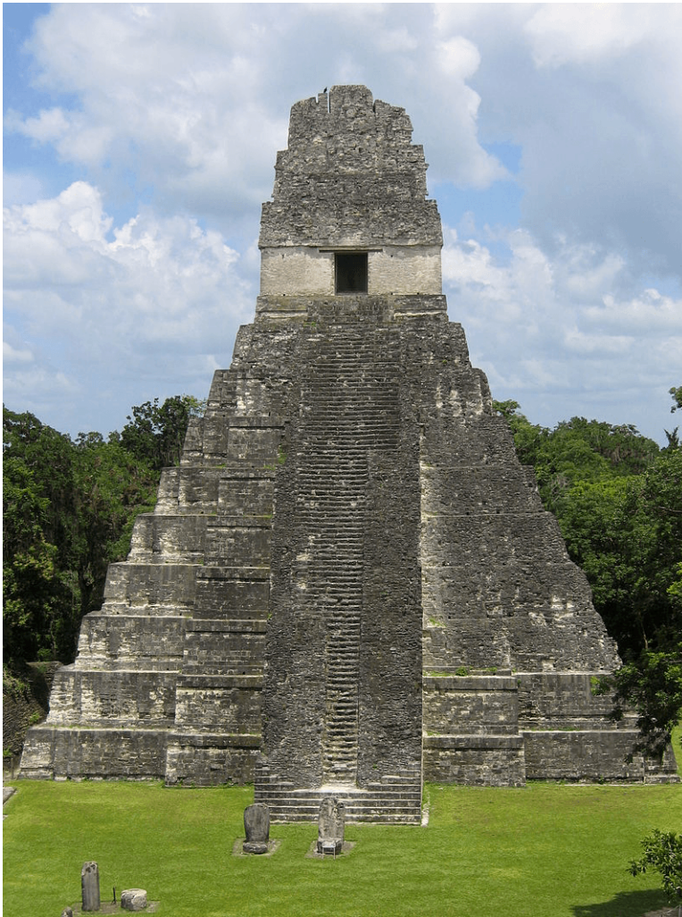
Figura 7: Temple piramidal del Tikal.