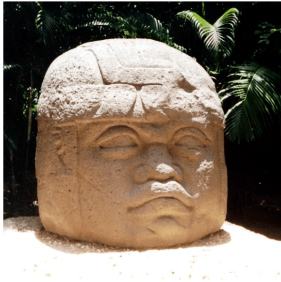
Figura 2: Cap olmeca. La Venta. Font: Wikipedia

perfecció difícilment equiparable a la resta de manifestacions artístiques d'altres cultures mesopotàmiques. Com a referent d'aquesta sèrie de figures humanes es considera una escultura anomenada El lluitador , procedent de Santa María Uxpanapa (Veracruz) que representa a un home barbut amb les cames i els braços doblats, oferint una imatge de gran esforç físic.