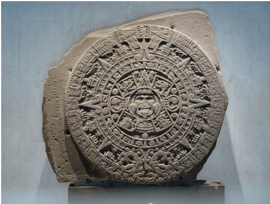
Figura 10: Calendari solar Asteca. Font: Wikipedia