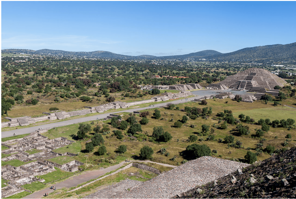
Figura 6: Piràmide de la Lluna, Teotihuacan.

Cal també destacar de l'art Teotihuacàn la gran producció i varietat de pintura mural. Tot i que algunes d'aquestes pintures murals van ser trobades als temples (com el temple de l'Agricultura), la major part van ser descobertes a les zones residencials que es coneixen sota el nom de Tepantitla, Tetitla, Atetelco, Zacuala i Yahualala. De tots els murals descoberts, el més rellevant és el que es coneixen com a Paradís de Tláloc , a Tepantitla (300 - 700 d.C.).