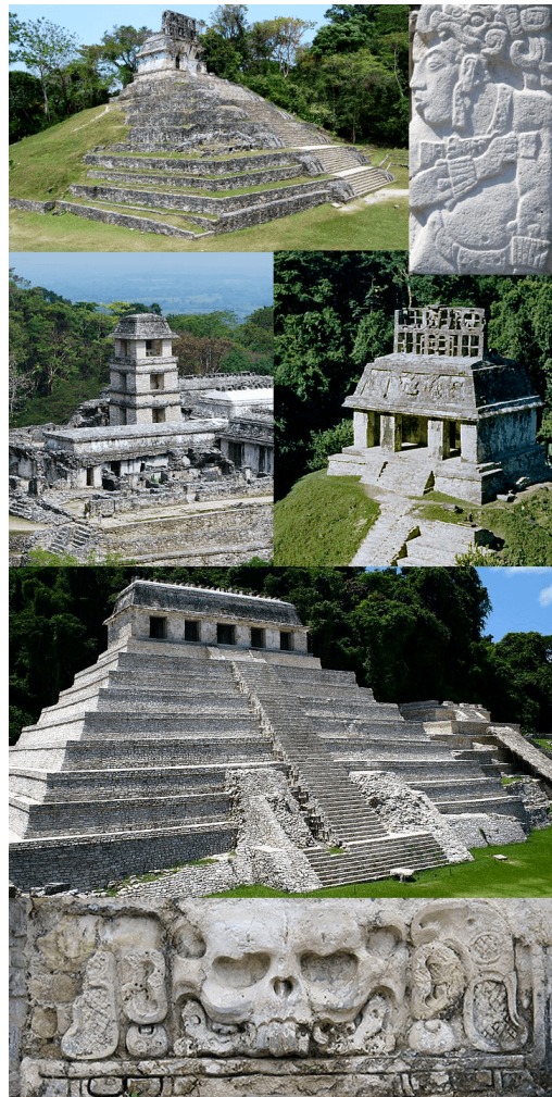
Figura 8: Palau de Palenque.

no que també presenta una distribució singular i un gran nombre de relleus en “estuco”.