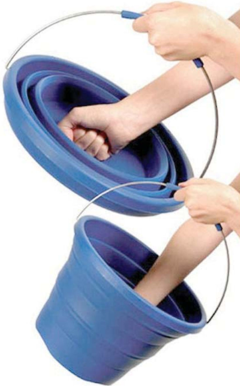
IMATGE B. Pack-Away Bucket

En la imatge B es pot observar un cubell plegable. Expliqueu els avantatges i els inconvenients del cubell plegable respecte als cubells convencionals.