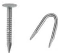
IMATGE F. Clau per a l'estructura de fusta (esquerra) i grampilló per a subjectar la malla als llistons de fusta (dreta).

Utilitzeu el quadern de respostes obert per a aconseguir el format DIN A3 de la doble plana, de manera que entregueu: