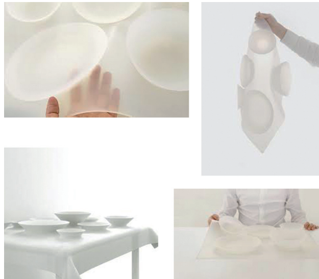
IMATGE B. Meal Tray ('Safata per a Menjar'), feta de silicona i apta per a menjar-hi. MAEZM, Corea, 2008.

Observeu aquest objecte (imatge B) i comenteu-ne els avantatges i els inconvenients. Proposeu alguna millora que en faciliti l'ús quotidià.