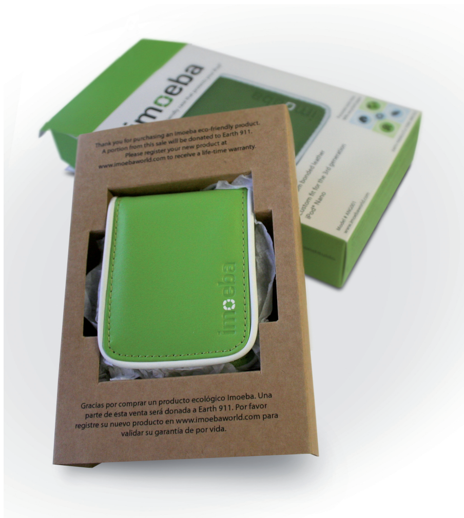
IMATGE D. Ecopack per a la funda d'un iPod.

En la imatge D es mostra un embalatge d'un producte ecològic. Comenteu-ne els atributs gràfics i sígnics que operen en consonància amb la consciència ambiental.