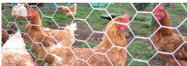
IMATGE E. Model de malla hexagonal.