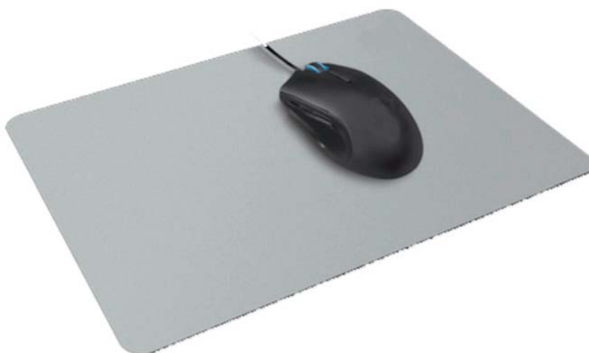
IMATGE F. Estoreta i ratolí d'ordinador

La mida de l'estoreta ha de ser 22 \times 17 cm i s'ha d'estampar a una tinta.