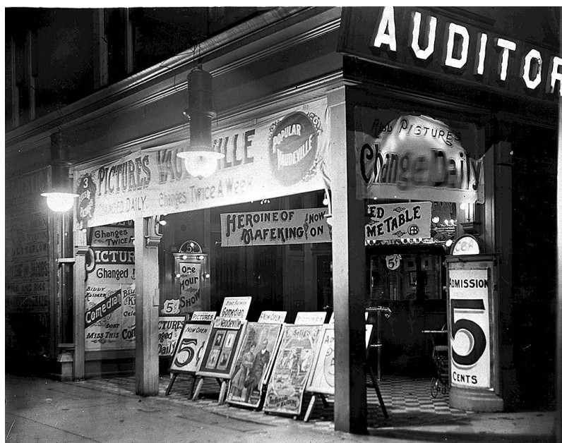
Nickelodeon, o sala de reproducció de cinema a Toronto.

Les sales per visualització pública de filmacions en blanc i negre, i les sales tipus Nickelodeon, petites sales on es projectaven pel·lícules i proliferaren al voltant del 1905 com a espais d'oci on es reproduïen filmacions sovint acompanyades amb música en directe.