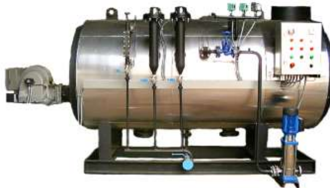
Caldera industrial de gas

En la indústria, l'absència d'impureses —de cendres o sofre- i l'elevat poder calorífic del gas natural fa que en treguin profit nombrosos sectors. Així, s'ha convertit en pràcticament imprescindible en sectors com el de la ceràmica, el vidre, la porcellana, la metal·lúrgia, l'alimentari, el tèxtil o el del paper. En la indústria química, el gas natural té un doble paper, ja que, a més de servir de font de calor, és una matèria primera per a l'obtenció de diversos productes com el metà, que constitueix el producte base en la producció d'hidrogen, metanol, amoníac o acetilè.