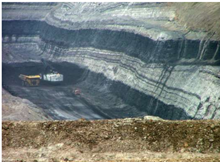
Mina de carbó a cel obert