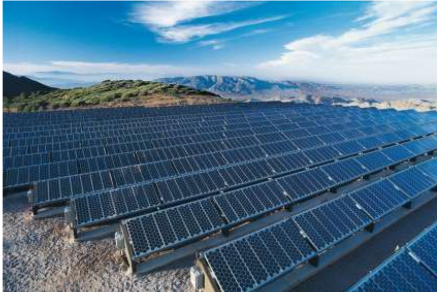
Cèl·lules solars de silici

de les forces que els lliguen al nucli i adquirint llibertat de moviment. Aquest espai que ha deixat l'electró tendeix a atraure qualsevol altre electró que estigui lliure. Per a convertir aquest moviment d'electrons en corrent elèctric es necessari encaminar el moviment dels electrons creant un camp elèctric en el sí del material.