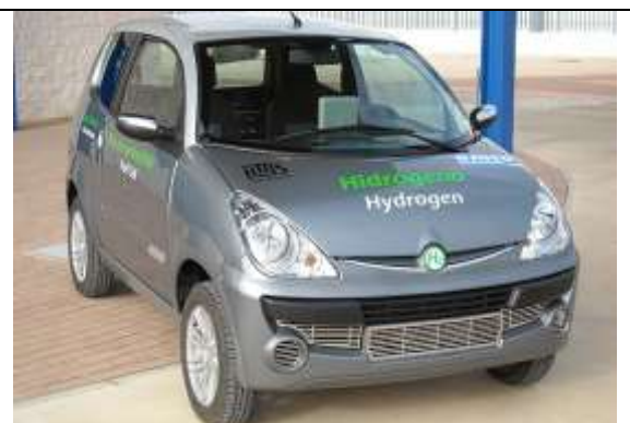
Cotxe que funciona amb motor d'hidrogen

Ara bé, segons els experts, la inversió necessària per a construir una economia basada en l'hidrogen i les piles de combustible s'estima en diversos centenars de milers de milions d'euros. I en posen un exemple: només la instal·lació d'assortidors d'hidrogen en el 30 % de les estacions de servei europees costaria entre 100.000 i 200.000 milions d'euros. Un estudi sobre la matèria assenyala també que, malgrat els esforços, la Unió Europea està per darrere dels Estats Units quant a finançament de projectes, on les despeses en aquest sector són entre cinc i sis vegades superiors a les que dedica la UE