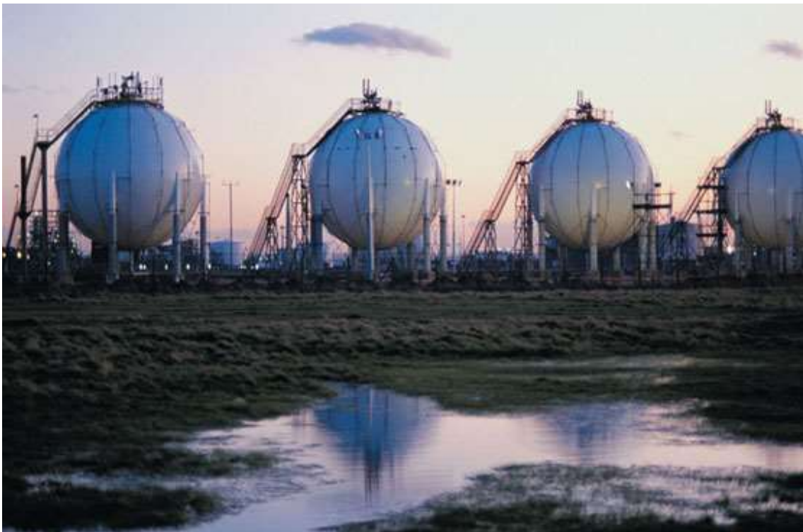
Dipòsits de gas natural

Per extreure l'energia continguda en els enllaços químics C-H, s'ha de produir el procés de combustió. La combustió és una reacció d'oxidació exotèrmica d'un cos combustible (en aquest cas, gas natural) amb un altre cos oxidant (aire), anomenat comburent. Aquesta transformació va acompanyada de desprendiment de calor i el fenomen acostuma a ser perceptible per la presència d'una flama que constitueix una font de llum i calor. La utilització del gas natural, com succeeix amb qualsevol altra font d'energia, ve determinada per la capacitat humana d'enginyar màquines i estris que aprofitin el seu potencial energètic. Tots els sectors de l'activitat humana en treuen profit actualment, principalment en el sector domèstic i en el comercial i l'industrial, atès que la seva versatilitat i comoditat d'ús ha afavorit el desenvolupament d'un ampli ventall de tecnologies adaptades a cada ús.