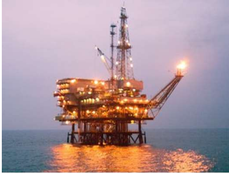
Plataforma Casablanca, pou d'extracció de petroli, davant la costa tarragonina

dir, sense oxigen, i sota pressions i temperatures elevades dóna lloc a un líquid viscos format per milers d'hidrocarburs diferents: el petroli. Existeixen diferents menes d'hidrocarburs, amb fórmules químiques diverses. El poder calorífic aproximat és de 10.000 kcal/kg. Els elements químics bàsics dels hidrocarburs són el carboni (C) i l'hidrogen (H), al igual que molts dels compostos elementals dels organismes com, per exemple, els glúcids o els àcids grassos, fet que explica el seu origen orgànic.