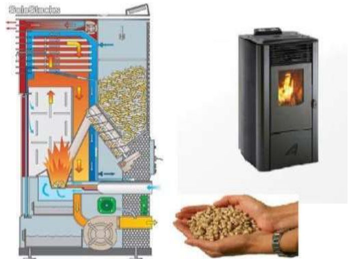
Estufa que funciona amb pel·lets de biomassa.