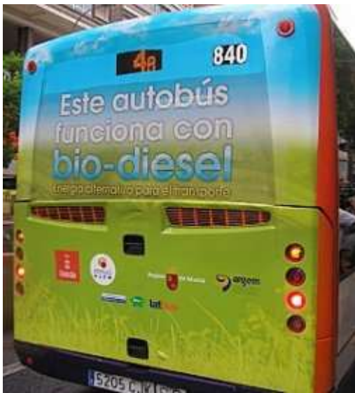
Autobús que usa biodiesel.

Entre els diversos avantatges de l'ús de la biomassa com a combustible, hi ha la seva disponibilitat i el fet que es tracta d'un recurs renovable i de tecnologia barata. Un dels inconvenients, però, és que no és una font d'energia completament neta.