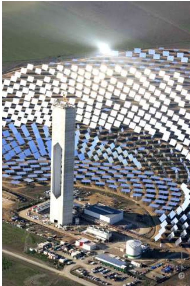
Central solar de torre

calorífica, de la radiació solar incident. Una instal·lació solar tèrmica està formada bàsicament per un camp de col·lectors solars, un conjunt de canonades aïllades tèrmicament i un dispositiu acumulador d'aigua.