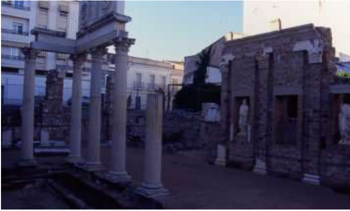
Restes del pòrtic del fòrum municipal