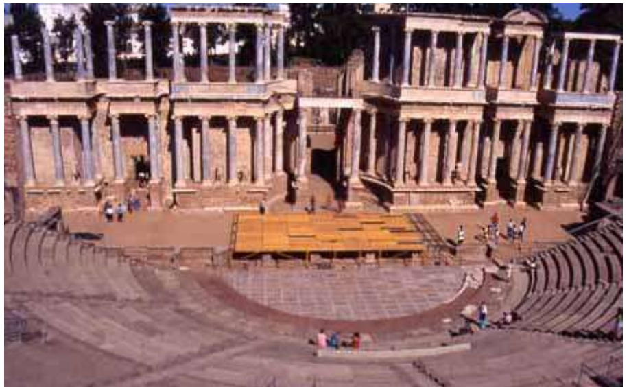
El frons scaenae del teatre, des d'un uomitorium i des de la cauea