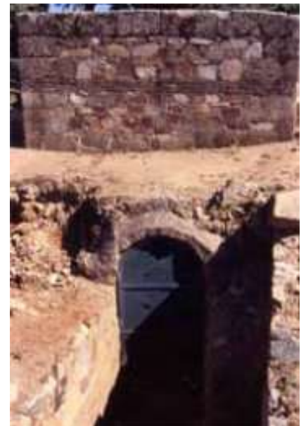
Castellum aquae de l'aqüeducte de San Lázaro

Més imatges en Simulacra Romae i Un paseo por Augusta Emerita