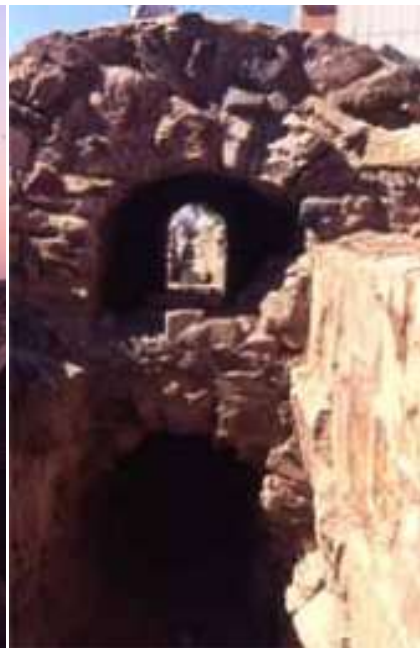
Aqüeducte de San Lázaro