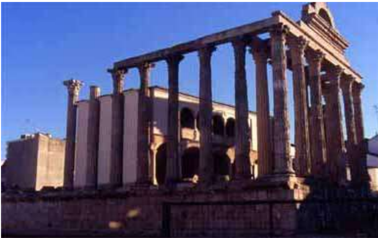
Restes del temple erròniament anomenat de Diana i en realitat dedicat al culte imperial, en el fòrum municipal