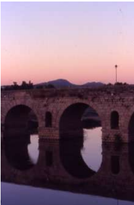
Detall del pont sobre el Guadiana