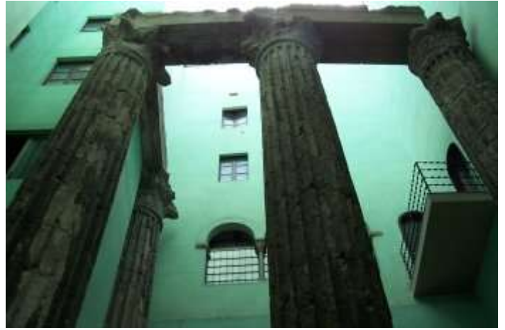
Les úniques quatre columnes que resten del temple (dins el al Centre Excursionista de Catalunya, C. Paradís, 11)