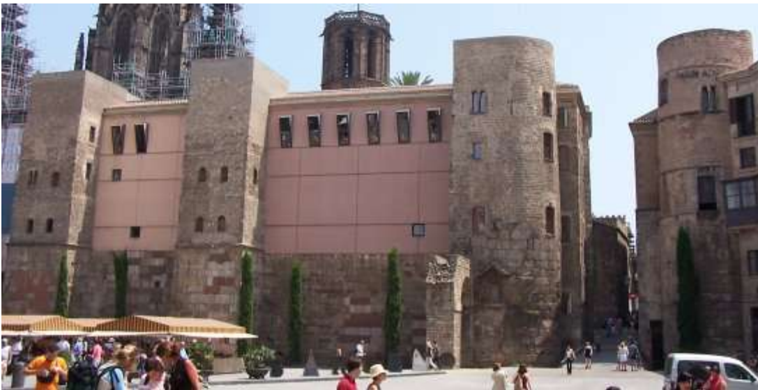
Quatre de les torres de la muralla romana, ara incorporades a la Casa de l'Ardiaca i el Palau del Bisbe, a la plaça Nova. Les dues semicirculars emmarcaven una de les portes de la ciutat, que donava pas al Decumanus Maximus (avui C. del Bisbe). S'hi pot veure també una arcada reconstruïda d'un dels aqüeductes.