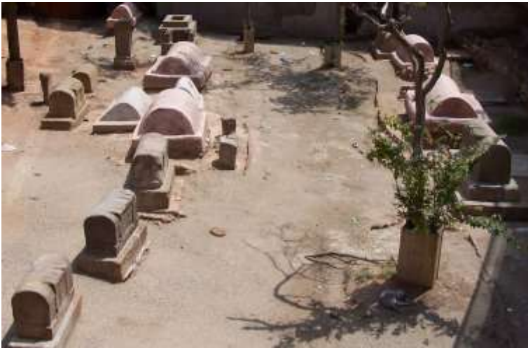
Necròpolis de la plaça de la Vila de Madrid