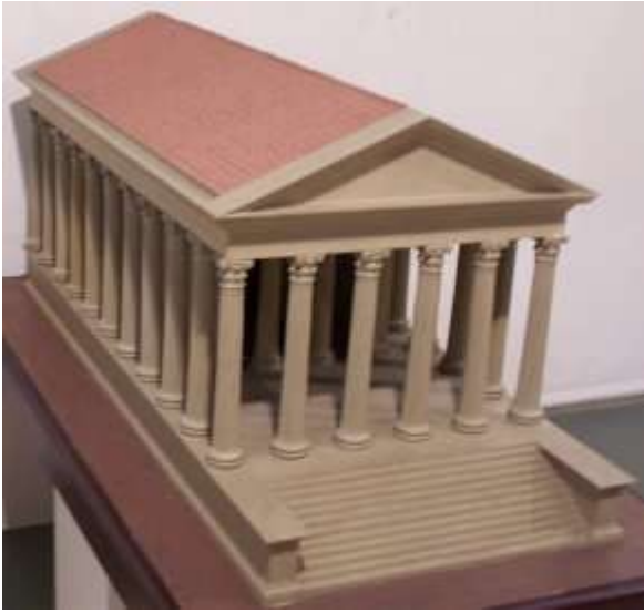
Maqueta de la reconstrucció del temple, construït a finals del segle I aC (Museu d'Arqueologia de Catalunya, Barcelona)