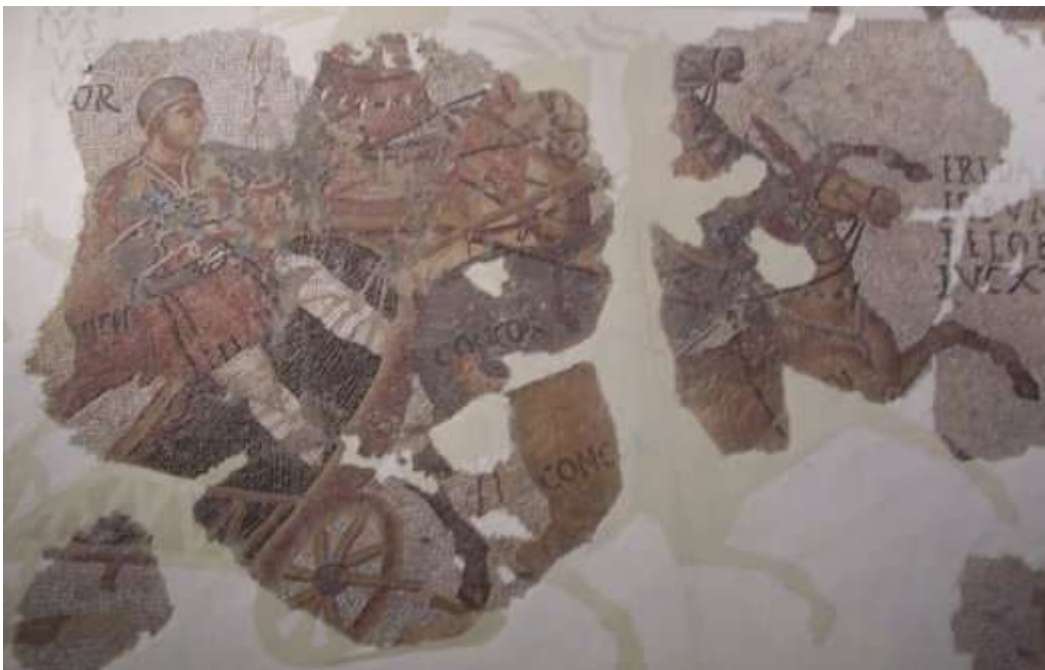
Quadriga (detall del mosaic del circ, segle IV dC, Museu d'Arqueologia de Catalunya, Barcelona)