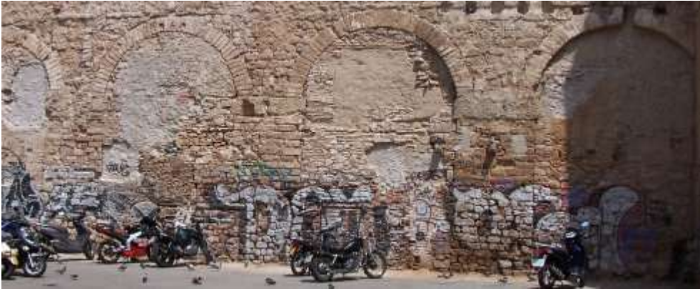
Les quatre arcades que resten de l'aqüeducte de la Barcelona romana al carrer de Duran i Bas, conservades en la paret d'una casa però en l'actualitat en una situació ben lamentable