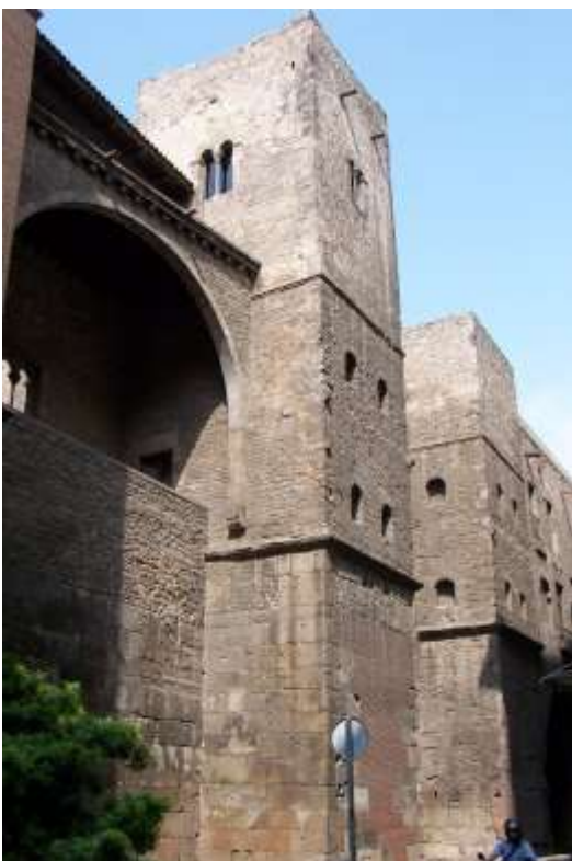
La muralla romana al carrer del sots-tinent Navarro, amb la volta medieval del Palau Requesens, actualment seu de la Reial Acadèmia de Bones Lletres.