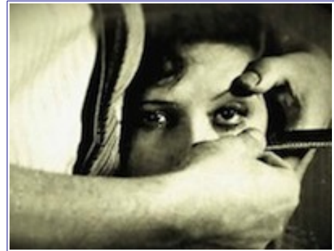
Buñuel: Un chien andalou (1929)

Con el término “Vanguardias” nos referimos a un conjunto de movimientos artísticos y literarios surgidos alrededor de la primera guerra mundial (1914-1918) que desarrollan concepciones profundamente nuevas en la cultura europea. Sus propuestas estéticas son originales, provocativas, combativas, radicales y minoritarias, expresadas en los sucesivos “manifiestos”. Su mayor logro fue imponer la libertad total del artista respecto a su obra y a los destinatarios de la misma. También se les llamó “ismos”. Estos se suceden a un ritmo rápido: expresionismo, futurismo, cubismo, dadaísmo, surrealismo, etc. Muchos de ellos afectan por igual a las artes plásticas, escénicas, cinematográficas, a las letras e incluso al pensamiento. Aunque su duración es limitada y su pervivencia, efímera, la huella que dejan es importante. Estos movimientos se prolongan hasta la crisis de los años 30 y el comienzo de la segunda guerra mundial (1939-1945)