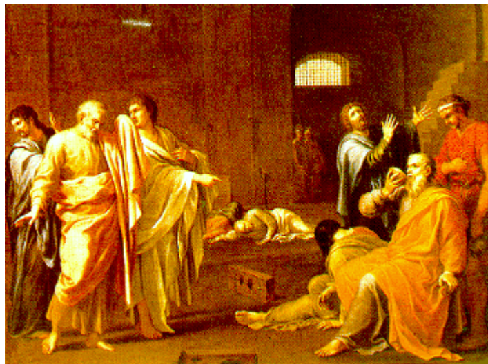
La mort de Sòcrates