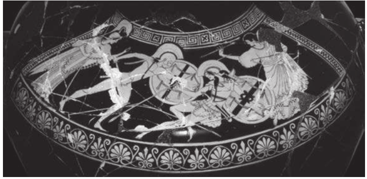
Ceràmica de figures vermelles (500-450 aC), Museu Gregorià Etrusc del Vaticà (Roma)

Aquesta imatge mostra la mort d'Hèctor. Feu una redacció (entre cent cinquanta i dues-centes paraules) en què expliqueu com es produeix aquest fet segons la narració de la Ilíada . El vostre text ha de donar resposta a les preguntes següents: