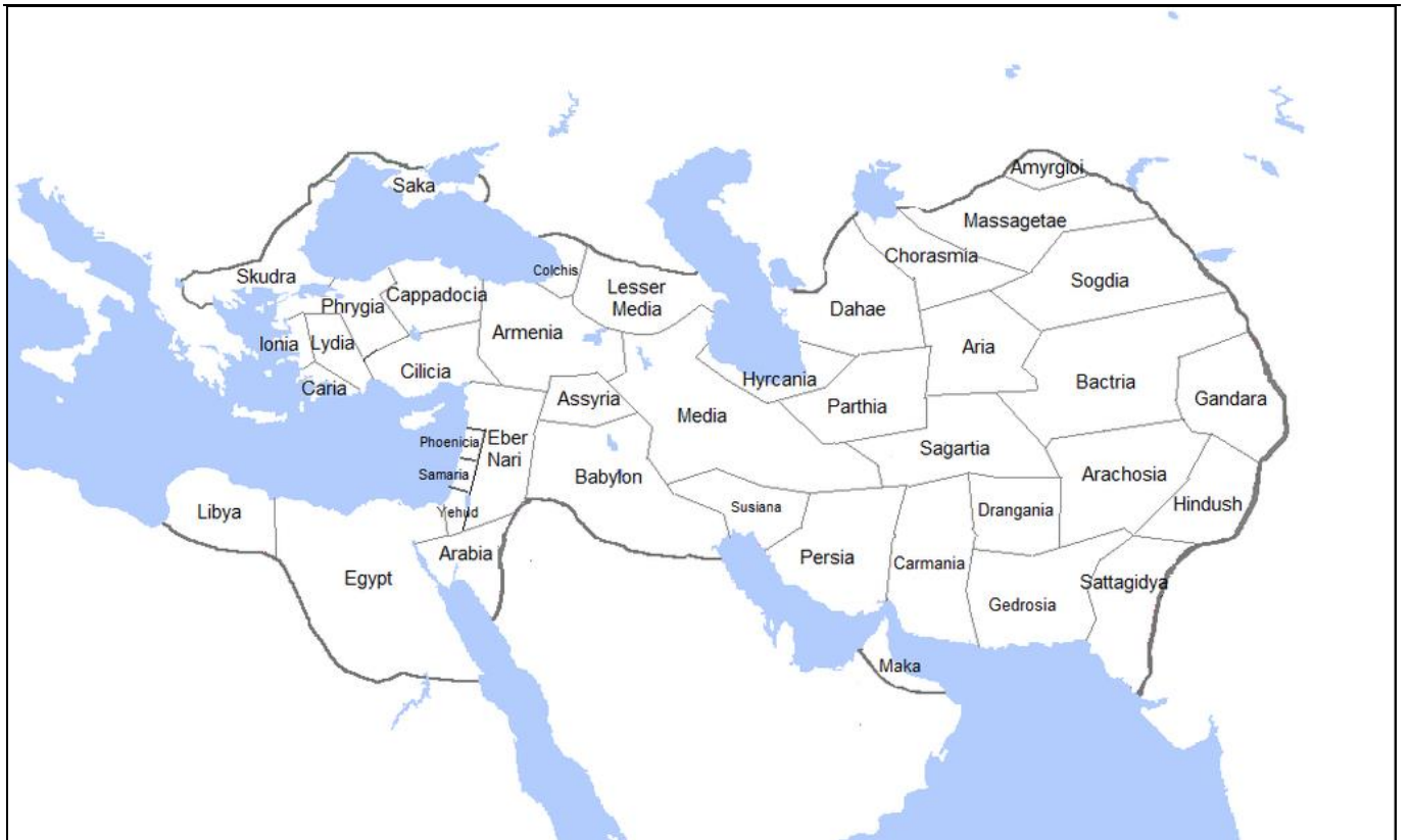
L'imperi persa abans d'Alexandre