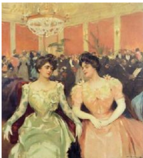
Ramon Casas: Saló de descans (1901-1902) (Cercle del Liceu)

L'evolució posterior de la pintura de Casas i de Rusiñol registra un progressiu abandonament dels accents bohèmics i transgressors per a acostar-se a uns gustos més decididament burgesos. Aquests gustos són palesos a les composicions que Ramon Casas va realitzar per al Cercle del Liceu o en els típics jardins de Rusiñol.