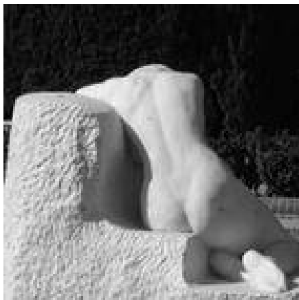
Josep Llimona: Desconsol (dors) (Còpia en Parc de la Ciutadella. Barcelona)