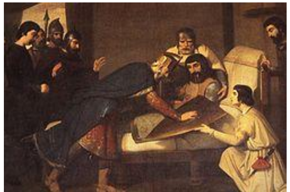
Claudi Lorenzale: Mort de Xifré el Pilós o també Origen de l'escut del casal de Barcelona (1843) (Reial Acadèmia Belles Arts de Sant Jordi)