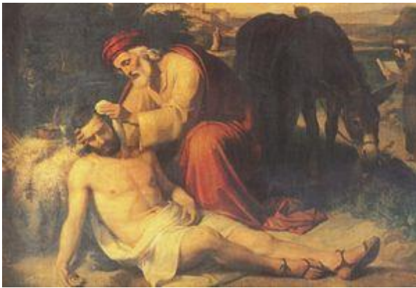
Pelegrí Clavé: El bon samarità , 1838 (Reial Acadèmia de Belles Arts de Sant Jordi)

Alguns dels artistes catalans que van anar a Roma cap al 1830, com Pau Milà i Fontanals, Claudi Lorenzale o Pelegrí Clavé van entrar en contacte amb els nazarens i van adquirir alguns dels seus plantejaments. Principalment van fer seva el seguiment d'una estètica volgutament arcaitzant i l'exaltació del sentiment patriòtic mitjançant la recreació d'episodis llegendaris de la història de Catalunya.