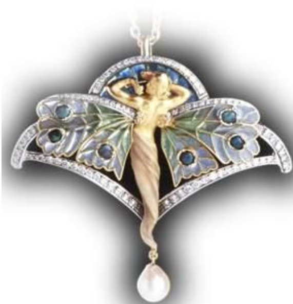
Lluís Masriera: Joia