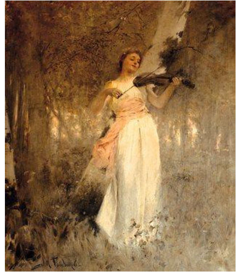
Josep Maria Tamburini: Harmonies del bosc.