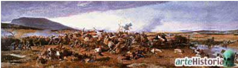
Marià Fortuny: Batalla de Wad Ras (1860-62) (Museo del Prado, Madrid)