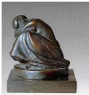
Manolo Hugué: Totote , 1909 (etapa parisina) (Col·lecció Particular)