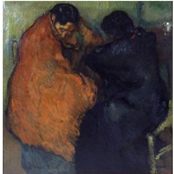
Isidre Nonell: Dues gitanes, 1903 (MNAC)