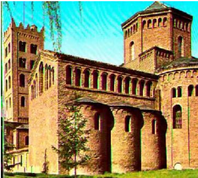
Monestir de Ripoll

Dins d'aquest ambient general, l'apreciació de l'art medieval –fins aleshores menystingut- unida a la Renaixença donen lloc a la restauració o reconstrucció de nombrosos monuments com ara el monestir de Ripoll. Aquestes intervencions es fan seguint els criteris de l'arquitecte restaurador francès E. Viollet-le-Duc.