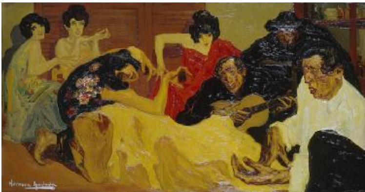
Hermen Anglada Camarasa: La danza española (1904) (Col·lecció privada)