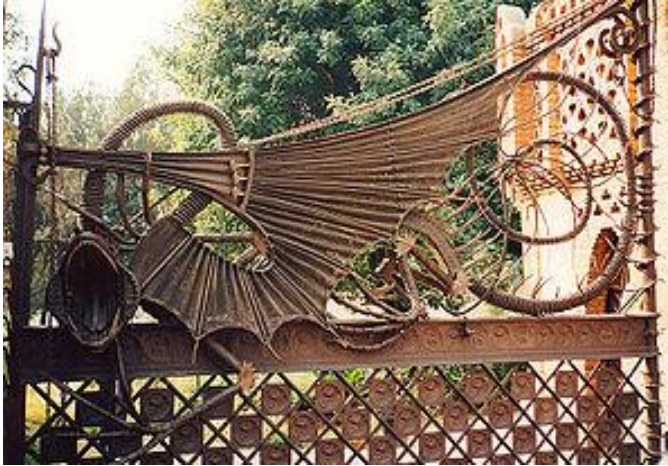
Disseny de Gaudí: Drac de la porta dels pavellons Güell de Pedralbes . Barcelona

Sota la direcció d'arquitectes com Lluís Domènech i Montaner, Antoni Gaudí o Puig i Cadafalch treballen una gran munió d'industrials i artesans que realitzen revestiment ceràmics, paviments, mosaics, esgrafiats, treballs de fusteria i ebenesteria, escultura decorativa, vitralls, reixes... D'aquesta manera la figura de l'arquitecte modernista, que també és l'autor de la dels dissenys que executen els artesans, assoleix un gran protagonisme.