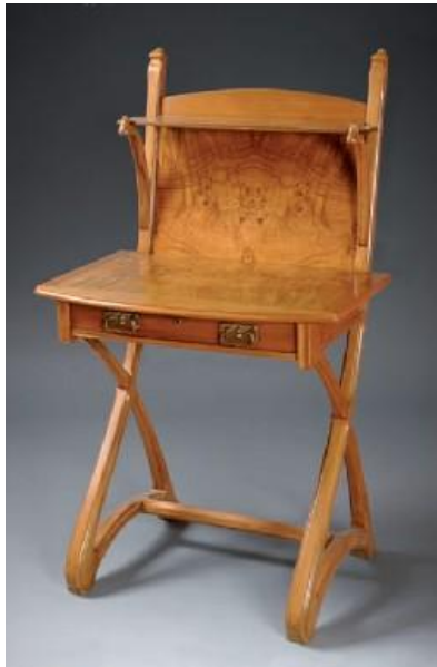
Joan Busquets: Escriptori femení (c. 1900)