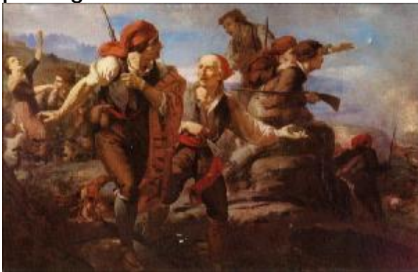
Ramon Martí i Alsina: El sometèn del Bruc , 1866 (MNAC)

A la pintura catalana, el capdavanter del realisme va ser Ramon Martí i Alsina qui va incidir també amb molta força en la temàtica paisatgista.