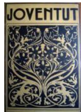
Idem: Revista Joventut