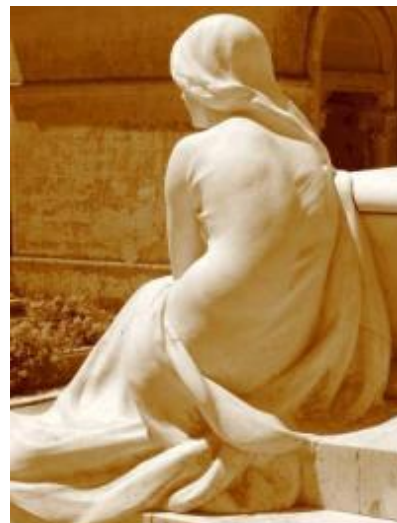
Josep Llimona: Escultura funerària . (Cementiri d'Arenys de Mar)