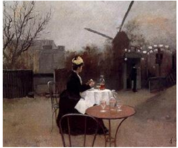
Ramon Casas: Plein aire , 1890-91. (MNAC)

Al mateix temps vivien una bohèmia daurada que va inspirar la creació de la cerveseria Els Quatre Gats, nucli essencial del Modernisme català. Un altre dels llocs essencials del modernisme és el Cau Ferrat, la casa-taller que Santiago Rusiñol va fer-se a Sitges.