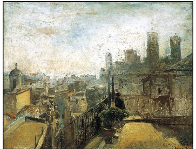
Ramon Martí i Alsina: Vista de Barcelona , 1889. (MNAC)