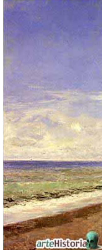
Fortuny: Platja de Portici (1874). (Meadows Museum, Dallas)