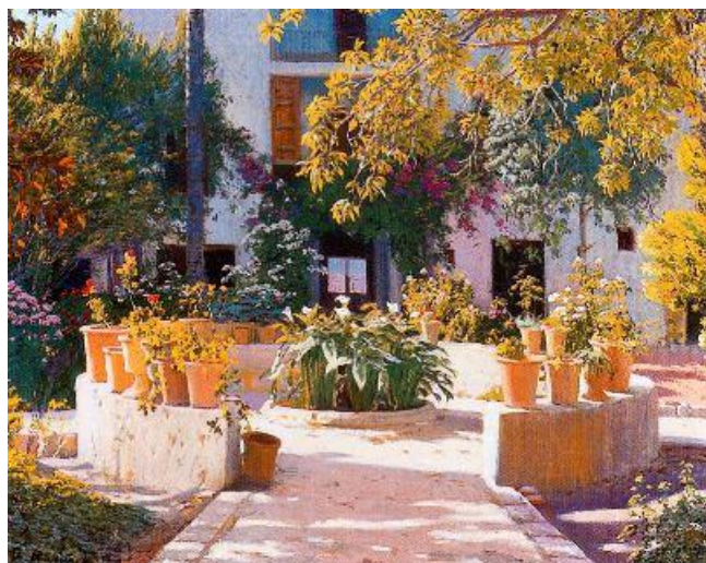
Santiago Rusiñol: Jardí (Col·lecció particular)