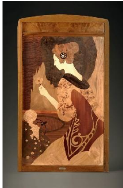
Joan Busquets: Plafó de marqueteria (c. 1900)