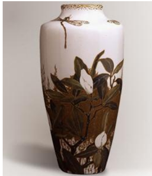
Antoni Serra Fiter: Gerro . (Masia Museu Serra)