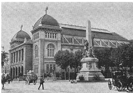
Palau de Belles Arts de l'Exposició Universal de 1888. Primera seu del Museu Municipal de Belles Arts de Barcelona