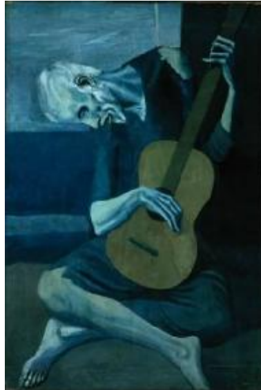
Pablo Picasso: Vell guitarrista cec , 1903. (Chicago Art Institute)