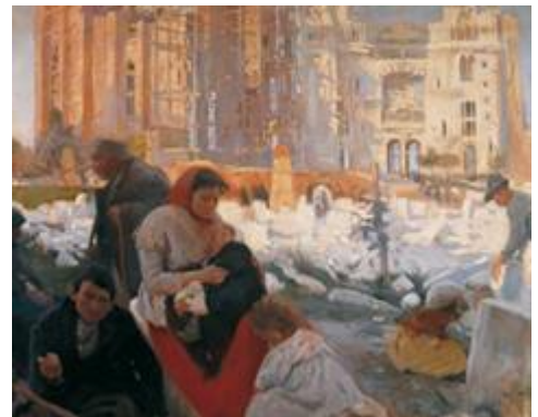
Joaquim Mir: La catedral dels pobres, 1898 (MNAC)

Característiques d'aquest corrent postmodernista (cal no confondre'l amb la postmodernitat de finals dels segle XX) és una presència més notable dels temes suburbials i marginals (els pobres de Mir, les gitanes de Nonell, els vells de Picasso ...) així com una denúncia més vigorosa del naturalisme en benefici de plantejaments de caràcter més expressionista.