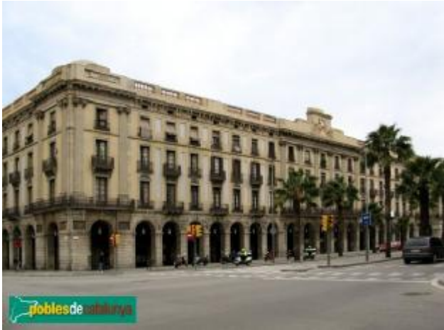
Porxos d'En Xifrà (Pla del Palau, Barcelona)