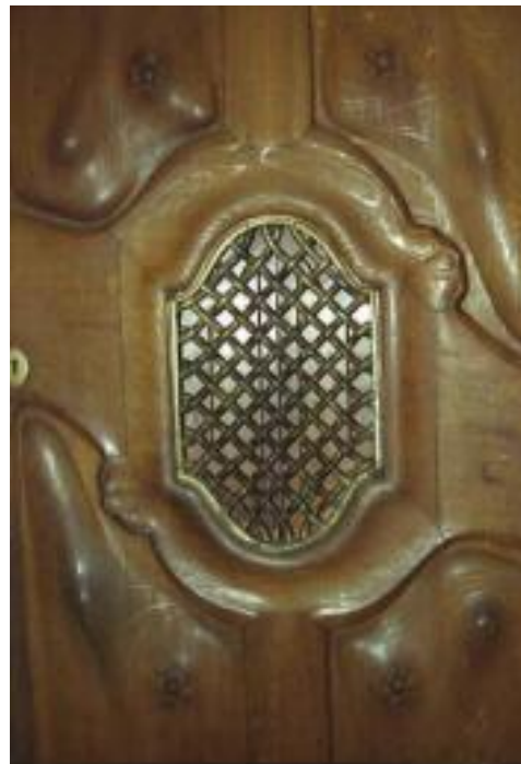
Casas i Bardés: Portes de can Batlló , Barcelona (arquitecte dissenyador Antoni Gaudí)