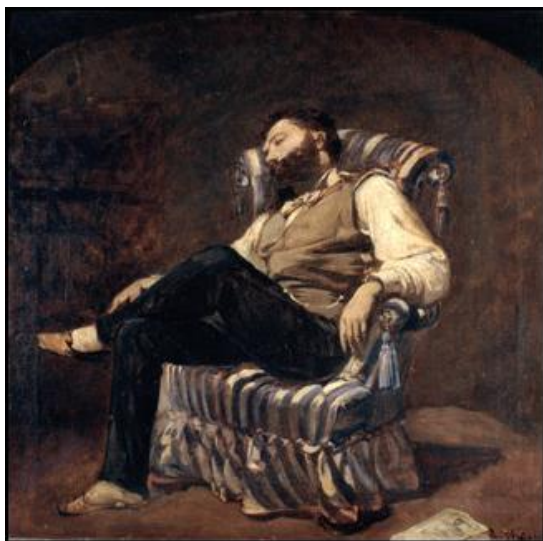
Ramon Martí i Alsina: La migdiada , 1884 (MNAC)