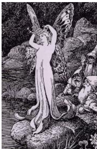
Apel·les Mestres (1907)