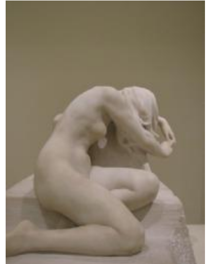
Josep Llimona: Desconsol (perfil) (MNAC)