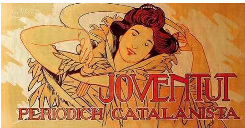
Alexandre de Riquer i Ynglada

L'aparició de les noves tècniques d'impressió i de reproducció de les imatges (xilografia a testa, litografia, galvanoplàstia, fotomecànica...) va donar lloc a un consum molt més massiu d'imatges mitjançant llibres, publicacions il·lustrades, cartells, impresos publicitaris, etc.