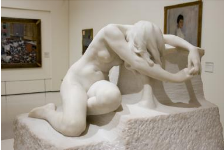
Josep Llimona: Desconsol . (MNAC)

L'obra de Josep Llimona, el més important dels escultors modernistes catalans, n'ofereix exemples prou significatius.