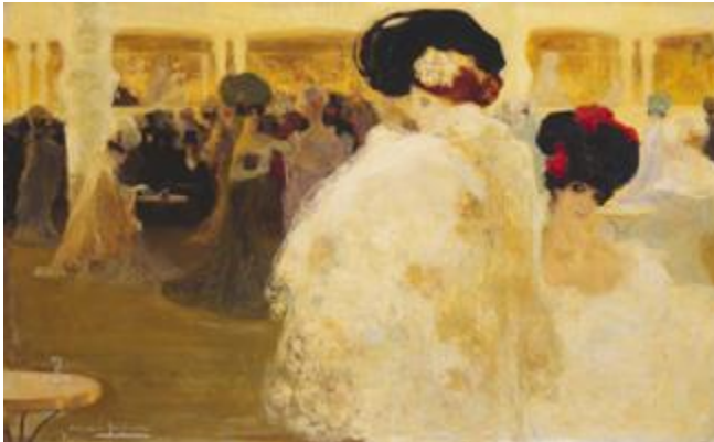
Hermen Anglada Camarasa: El casino de París (1900) (Col·lecció privada)