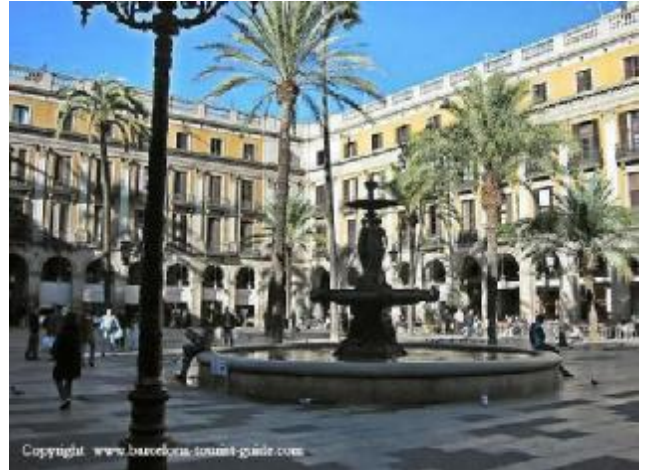
Plaça Reial, Barcelona.

Molts d'aquests nous espais urbans van se guanyats mitjançant la supressió de vells cementiris i, sobretot, enderrocant nombrosos convents afectats per les lleis desamortitzadores contràries als ordes religiosos.