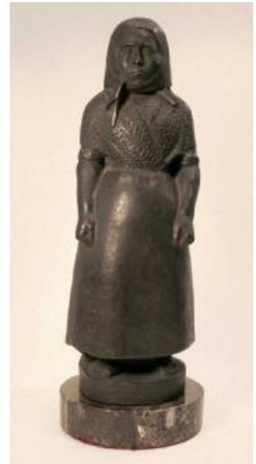
Manolo Hugué: La llobera , 1910-11 (primera etapa a Ceret) (Museu Europeu d'Art Modern, BCN)