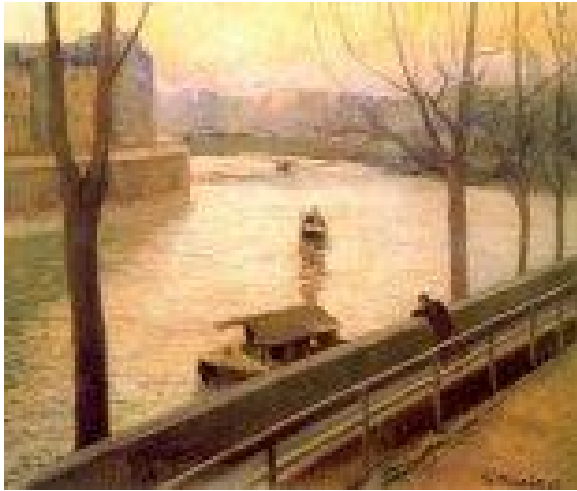
Santiago Rusiñol: Il·le Saint Louis de Paris (1890) (Abadia de Montserrat)