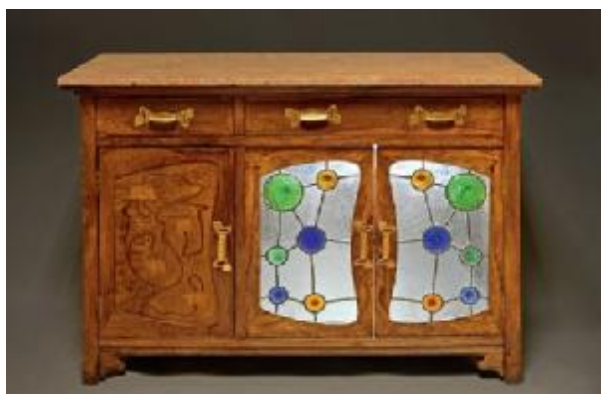
Gaspar Homar: Trinxant (c. 1904). Fusta, marqueteria, metalls i vidres emplomats.