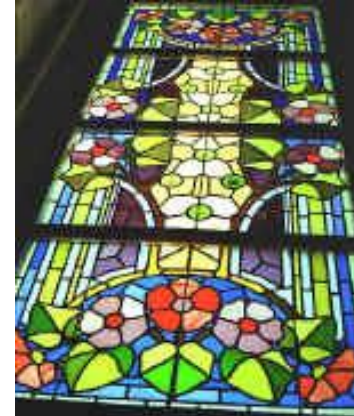
Jeroni Granell: Vidres del sostre de Casa Navàs , de Reus. Dibuixos de Gaspar Homar (arquitecte Lluís Domènech i Montaner)