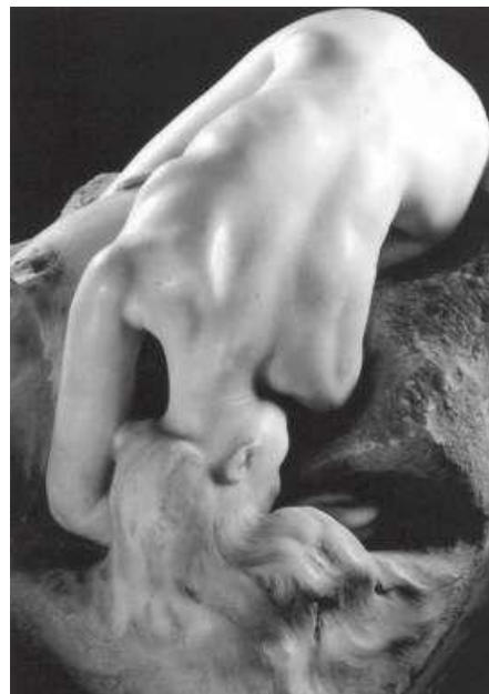
August Rodin: Danae (1889) (Musée Rodin)

L'escultura catalana del període del Modernisme es mostra molt atenta a les novetats que es donen a París i acusa molt especialment la influència de Rodin, el gran renovador del llenguatge escultòric de finals del segle.