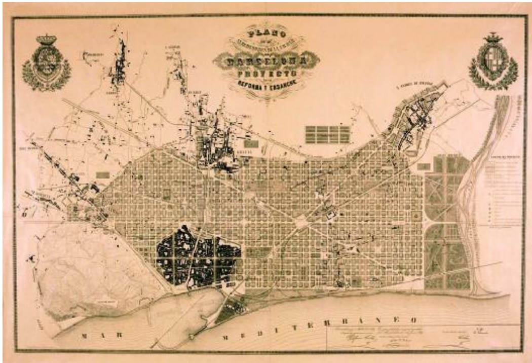
Ildefons Cerdà: Plano de Barcelona y sus cercanías. Proyecto de su reforma y ensanche . Abril 1859.

De fet, Cerdà va imaginar una ciutat nova, desvinculada de l'antiga i en situava el centre a la Plaça de les Glòries Catalanes. L'aspecte més característic del Pla Cerdà és el traçat rectilini dels carrers que componen una gran quadrícula amb illes de 113 x 113 metres.