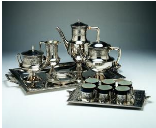
Lluís Masriera: Joc de te .

Davant d'aquest panorama decadent es van plantejar arreu d'Europa iniciatives de regeneració de les indústries artístiques, generalment basades en el tractament acurat dels materials i l'aposta per la innovació estètica, comptant sovint amb la participació de dissenyadors.