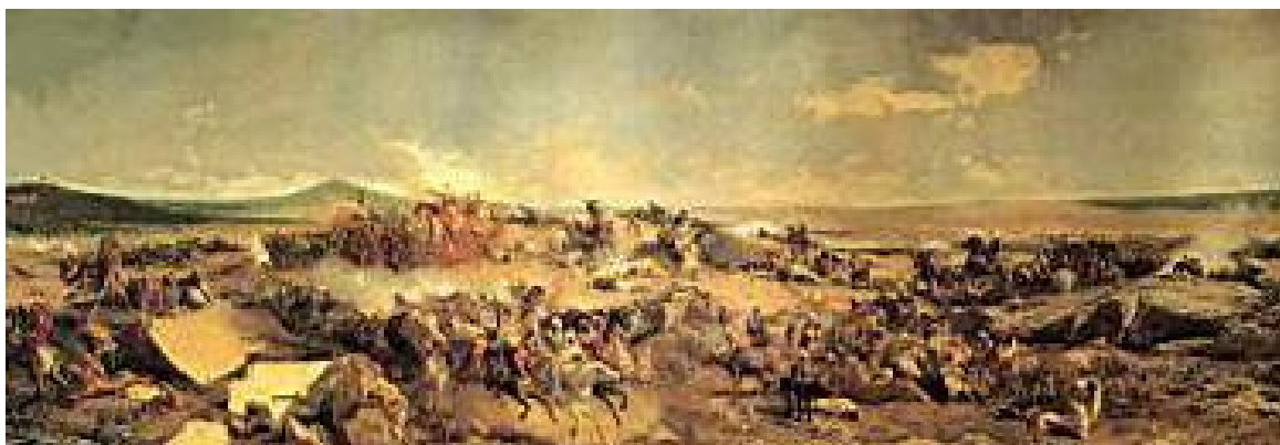
Marià Fortuny: La batalla de Tetuán . (1864-73) (MNAC)

El pintor català que durant el segle XIX va assolir una major projecció internacional va ser el reusenc Marià Fortuny (1838-1874). És autor de composicions de gènere o retrospectives resoltes amb una extraordinària habilitat i un gran domini del dibuix que van ser molt apreciades pels col·leccionistes europeus i americans del seu temps. Amb un estil preciosista, els darrers anys de la seva vida –va morir molt jove– va concedir un importància preferent als efectes atmosfèrics lumínics, apropant-se als plantejaments impressionistes.