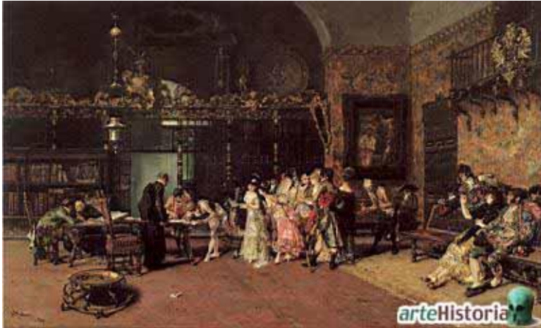
Marià Fortuny: La Vicaria (1870) (MNAC)