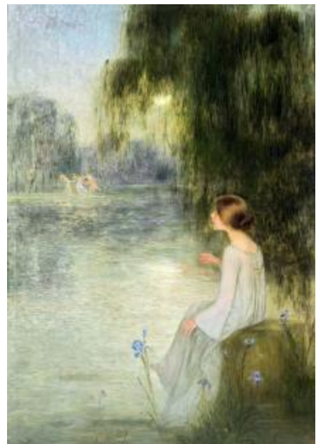
Joan Brull: Somni (MNAC)