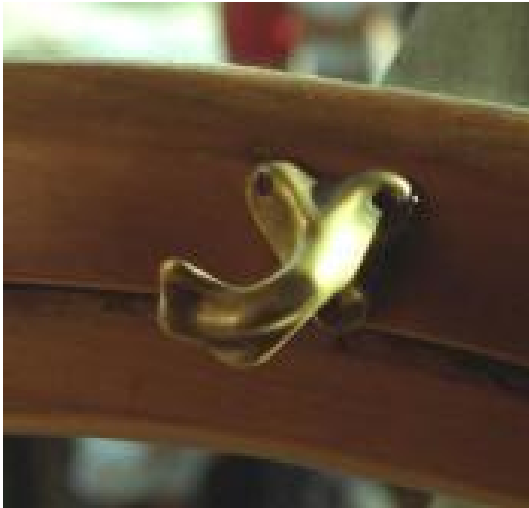
Antoni Gaudí: Tirador (Can Batlló, Barcelona)

A més a més, aquest procés comportava sovint una minva de la qualitat estètica i material dels productes destinat a la decoració o al parament de la llar, com poden ser mobles, objectes de ferro i bronze, vaixelles, peces d'argenteria, etc. L'ur qualitat material se'n ressentia per l'adopció cada vegada més freqüent de materials que imitaven els bons sense ser-ho (fustes tenyides, banys de plata, aliatges metal·lics, etc.), mentre la qualitat estètica decreixia a causa de la imitació dels estils històrics passats, com més pomposos millor.