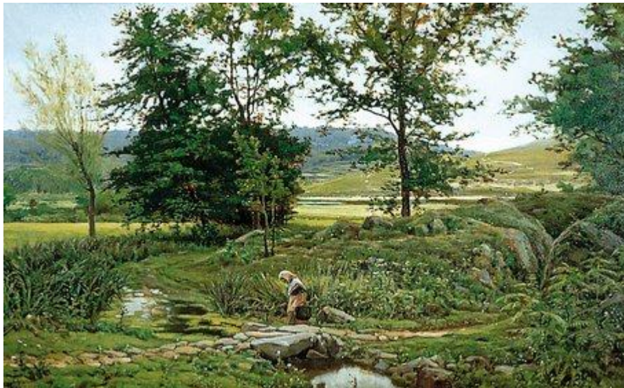
Joaquim Vayreda: Paisatge d'Olot , c. 1880

Deixeble de Ramon Martí i Alsina fou Joaquim Vayreda , figura central de l'anomenada Escola d'Olot , centrada en la recreació del paisatge natural i humà de la Garrotxa amb plantejament equivalents a l'Ecole de Barbizon francesa.