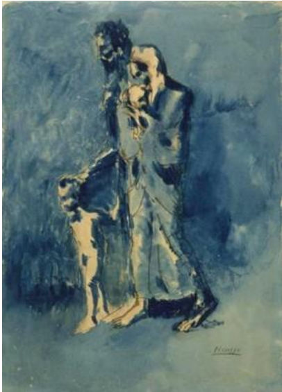
Pablo Picasso: Pobresa , 1903 (Witworth Gallery, Manchester)