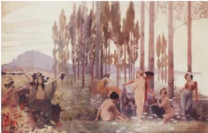
Alexandre de Riquer: El ball de la primavera. Plafó decoratiu de l'Institut Industrial de Terrassa (Museu Alegre de Sagrera)