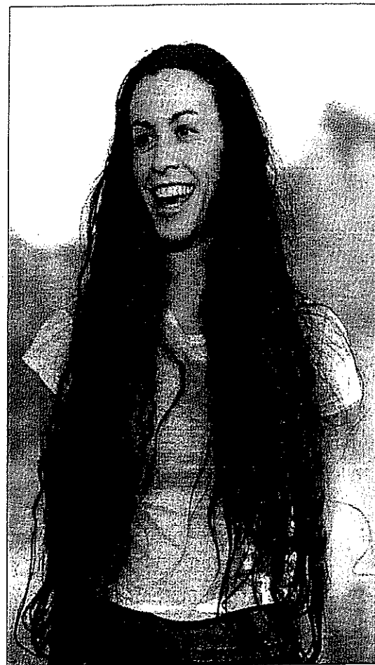
Los cantantes Beck (izquierda) y Alanis Morissette.

sa Etheridge o Boyz II Men. Y a unos cuantos más. Y no hablemos de los veteranos: David Bowie, Rod Stewart, incluso Sinéad O'Connor o Anita Baker, omnipresentes hace apenas 10 años, fueron abandonados por sus sellos discográficos.