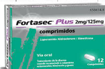
Loperamida Hidrocloruro Simeticona

Les persones amb gastroenteritis milloren per si soles, amb repòs i abundants líquids i electròlits.