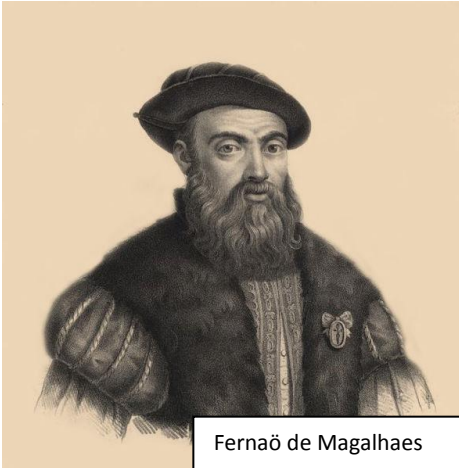
Fernaö de Magalhaes

Fernaö de Magalhaes, era un navegant d'origen portuguès, que va intentar altra vegada la ruta que ja s'havia proposat Cristòfol Colom, és a dir, arribar a les illes de les espècies navegant sempre en direcció oest. Per això va cercar un pas cap al sud, vorejant la costa del continent americà.