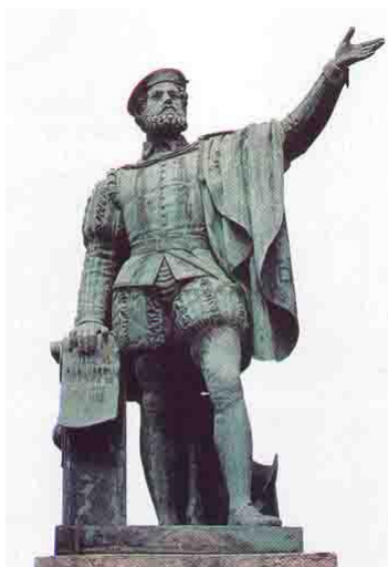
Monument a J.S. Elcano

Desembocamos por el Estrecho para entrar en el gran mar, al que dimos en seguida el nombre de Pacífico, y en el cual navegamos durante el espacio de tres meses y veinte días, sin probar ni un alimento fresco. El bizcocho que comíamos ya no era pan, sino un polvo mezclado de gusanos que habían devorado toda su sustancia, y que además tenía un hedor insoportable por hallarse impregnado de orines de rata. El agua que nos veíamos obligados a beber estaba igualmente podrida y hedionda. A menudo aun estábamos reducidos a alimentarnos de serrín, y hasta las ratas, tan repelentes para el hombre, habían llegado a ser un alimento tan delicado que se pagaba medio ducado por cada una. Sin embargo, esto no era todo. Nuestra mayor desgracia era vernos atacados de una especie de enfermedad que hacía hincharse las encías hasta el extremo de sobrepasar los dientes en ambas mandíbulas, haciendo que los enfermos no pudiesen tomar ningún alimento. De éstos murieron diecinueve y entre ellos el gigante patagón y un brasilero que conducíamos con nosotros. Además de los muertos, teníamos veinticinco marineros enfermos que sufrían dolores en los brazos, en las piernas y en algunas otras partes del cuerpo, pero que al fin sanaron.