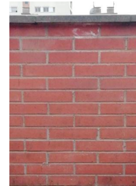
Paral·leles o perpendiculars?