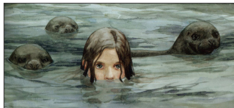
Imagen de americanaejournal.hu

Las selkies son criaturas mitológicas de las islas del norte de Escocia, aunque también están presentes en varias tradiciones de algunos países nórdicos.